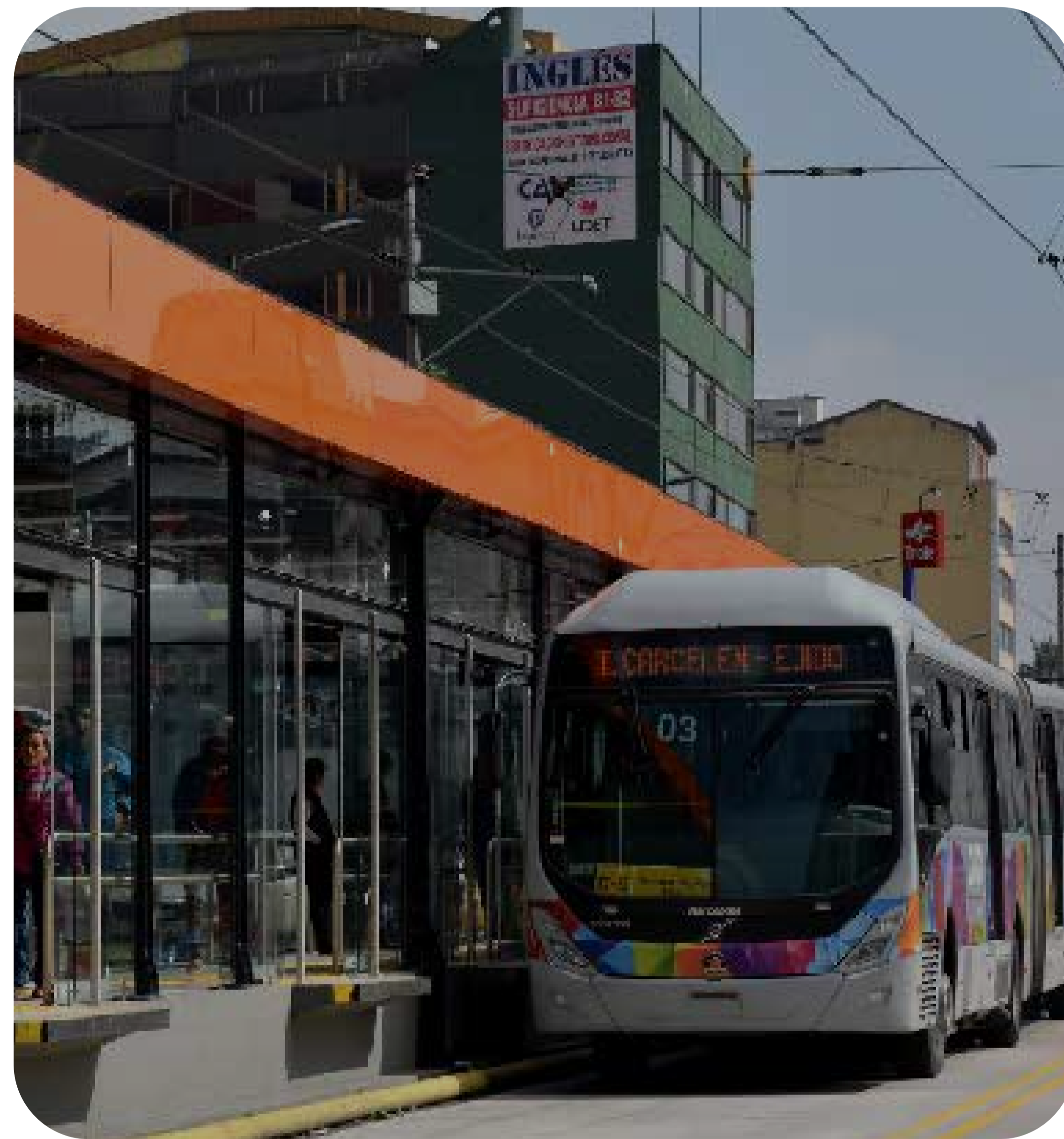
Figura 1. Corredor de trolebuses de Quito.

administrativa y de equipamientos, servicios públicos, comerciales, financieros, y educativos que conlleva a que entre los diferentes centros urbanos y su centralidad ocurran fuerzas que generan gran cantidad de viajes, lo que genera congestión y saturación de la red viaria.