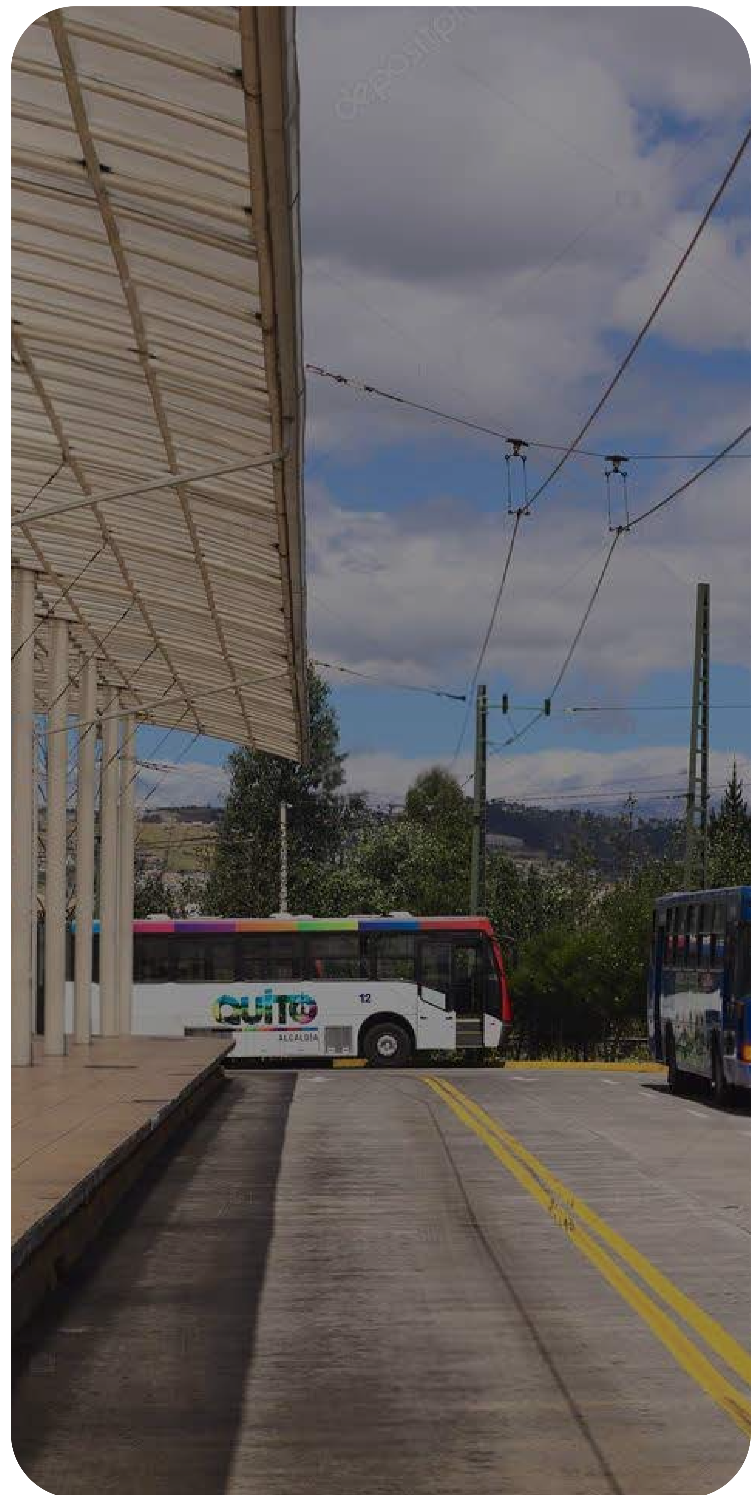
Figure 4. Estación de trolebuses de Quito.

Dentro del modelo de negocio para el caso de las baterías de los buses y de acuerdo al código orgánico del ambiente del Ecuador, se considera que su segundo uso le corresponderá al proveedor de flota.