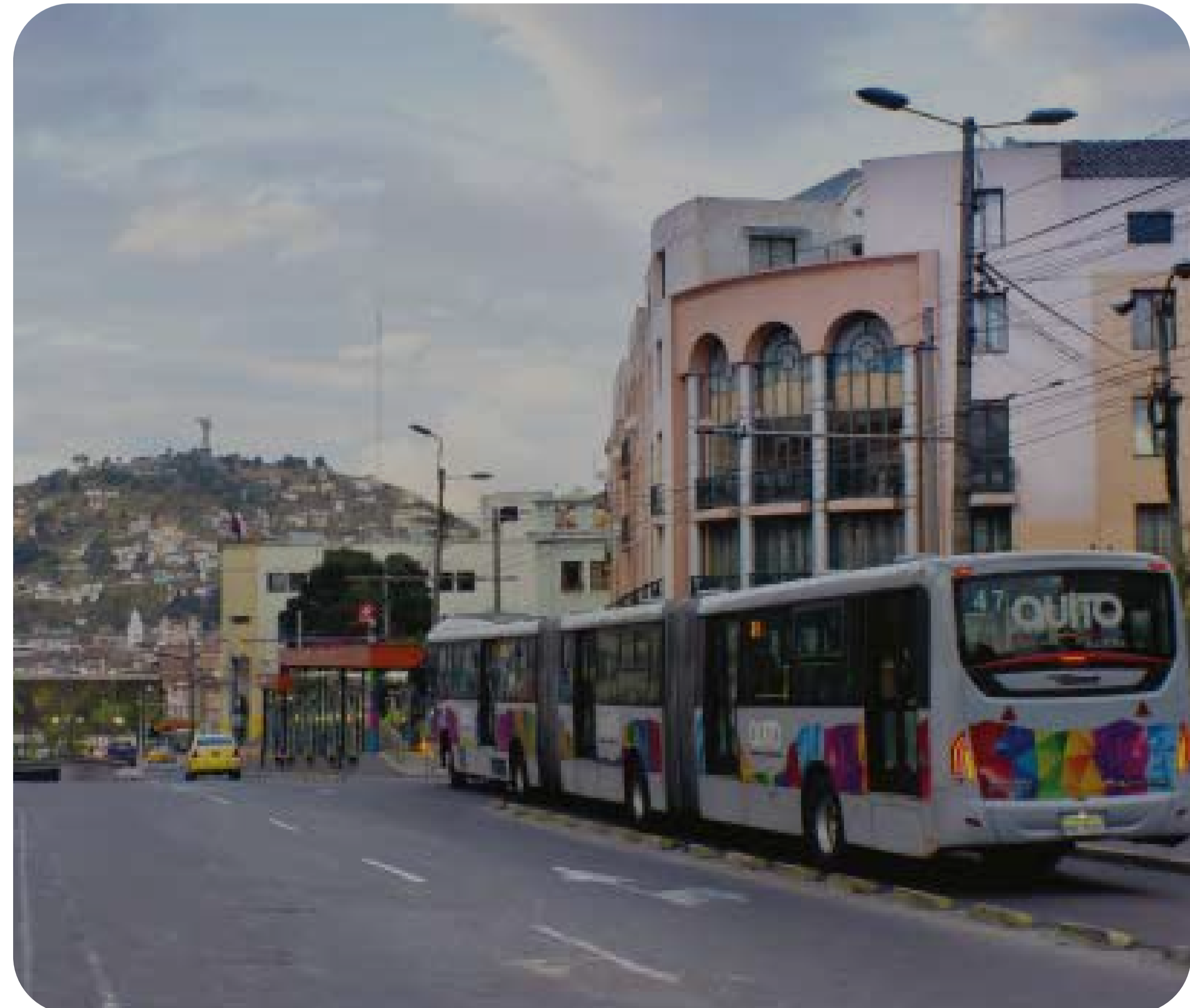
Figura 3. Trolebús de Quito en la región de San Blas