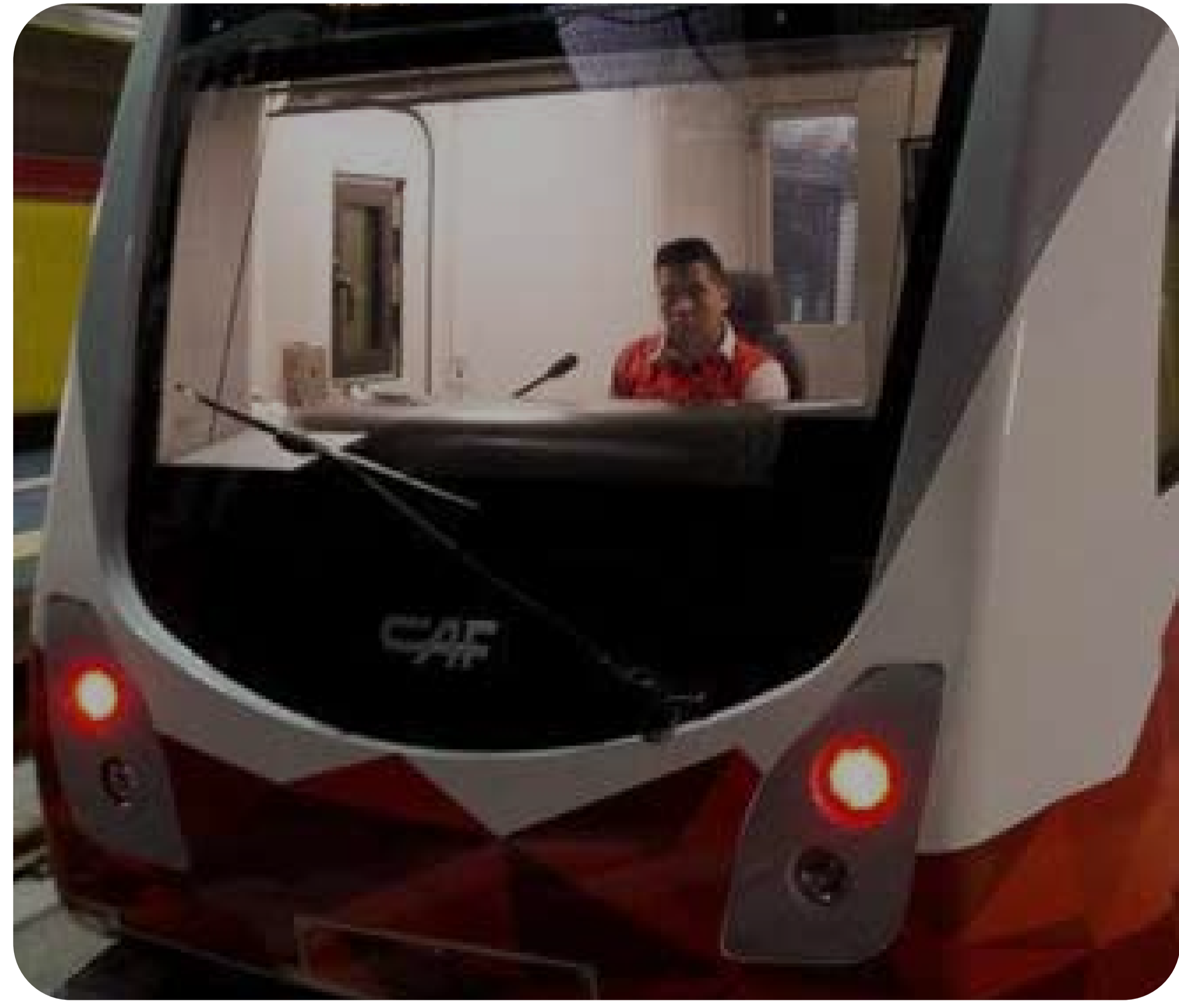
Figura 2. Metro de Quito.

La progresiva incorporación de buses eléctricos en Quito requerirá de una planificación de manera que la ciudad pueda prepararse en términos de su infraestructura eléctrica, aspectos normativos, operadores de transporte, proveedores de vehículos y capital humano que soporte este nuevo ecosistema de la movilidad eléctrica.