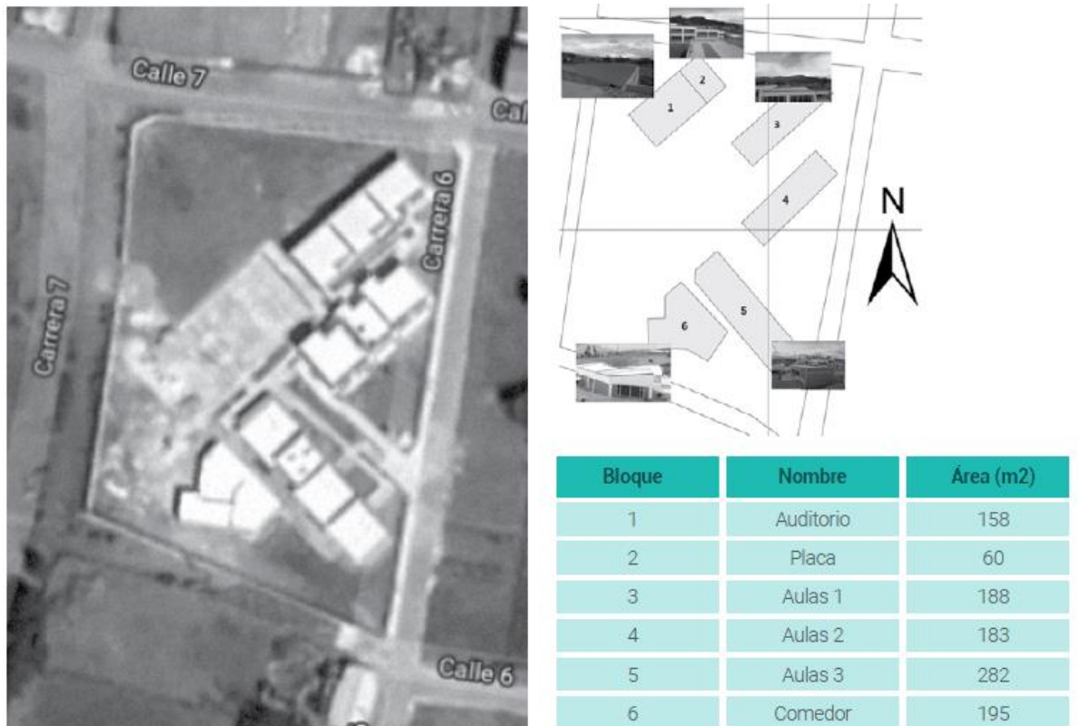
Figura 3. Áreas susceptibles de ser intervenidas