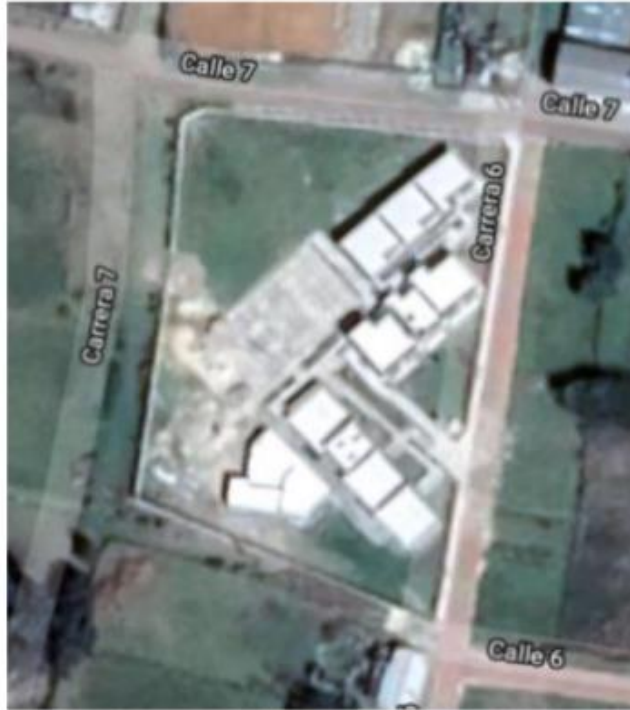
Figura 2. Visual satelital del IECJU