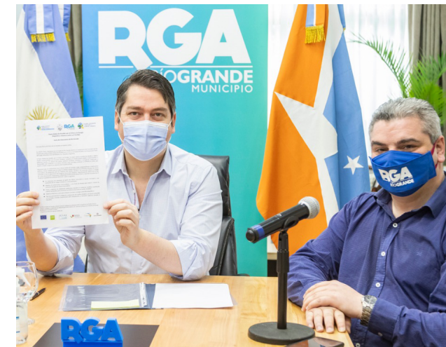
Firma de compromiso del Alcalde de Río Grande, Argentina

Unión Europea, C40 Cities Climate Leadership Group, ICLEI América del Sur, Banco de Desarrollo de América Latina (CAF), CDP, Alcaldía de Lima, y Ciudades y Gobiernos Locales Unidos (CGLU), representados por la Federación Latinoamericana de Ciudades, Municipios y Asociaciones de Gobiernos Locales (FLACMA) y Mercociudades.