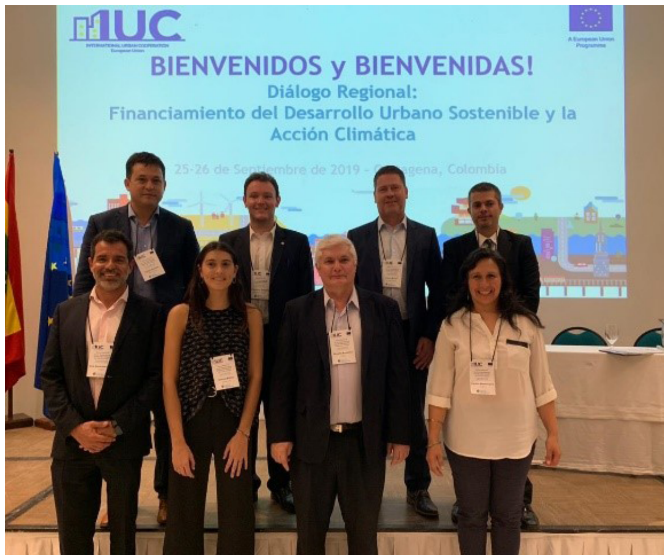
Taller de financiación climática de Cartagena de Indias (Colombia)

Desde 2017 ya son más de 380 ciudades firmantes en la región , representando a más de 140 millones de personas potencialmente impactadas positivamente por el programa.