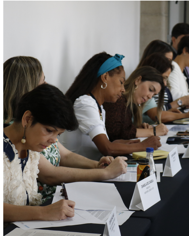
Encuentro de alcaldesas en Brasilia (Brasil)

Sin la acción local no se puede lograr la transformación verde justa y ecológica que nuestro modelo de sociedad necesita para poder re-equilibrar nuestra relación con el entorno y asegurar una calidad de vida a las generaciones futuras. Esta visión de re-equilibrio con nuestro planeta necesita a las ciudades para traducir su significado en ámbitos