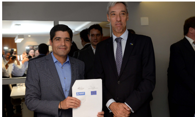
Firma del Alcalde de Salvador (Brasil) en presencia del ex Embajador de la Unión Europea, Joao Cravinho

Los Comités Nacionales y Regionales fueron importantes y estratégicos para dar solidez y demostrar la importancia de las acciones climáticas locales , para contextualizar y conciliar visiones globales con la realidad y desafíos territoriales locales y para articular, coordinar e intercambiar experiencias a nivel nacional. En este sentido, se identificó la necesidad de proporcionar capacitación y herramientas de comunicación ; sensibilizar a los integrantes con evidencias del valor agregado de la iniciativa y mantener el espacio de forma permanente y con reuniones constantes.