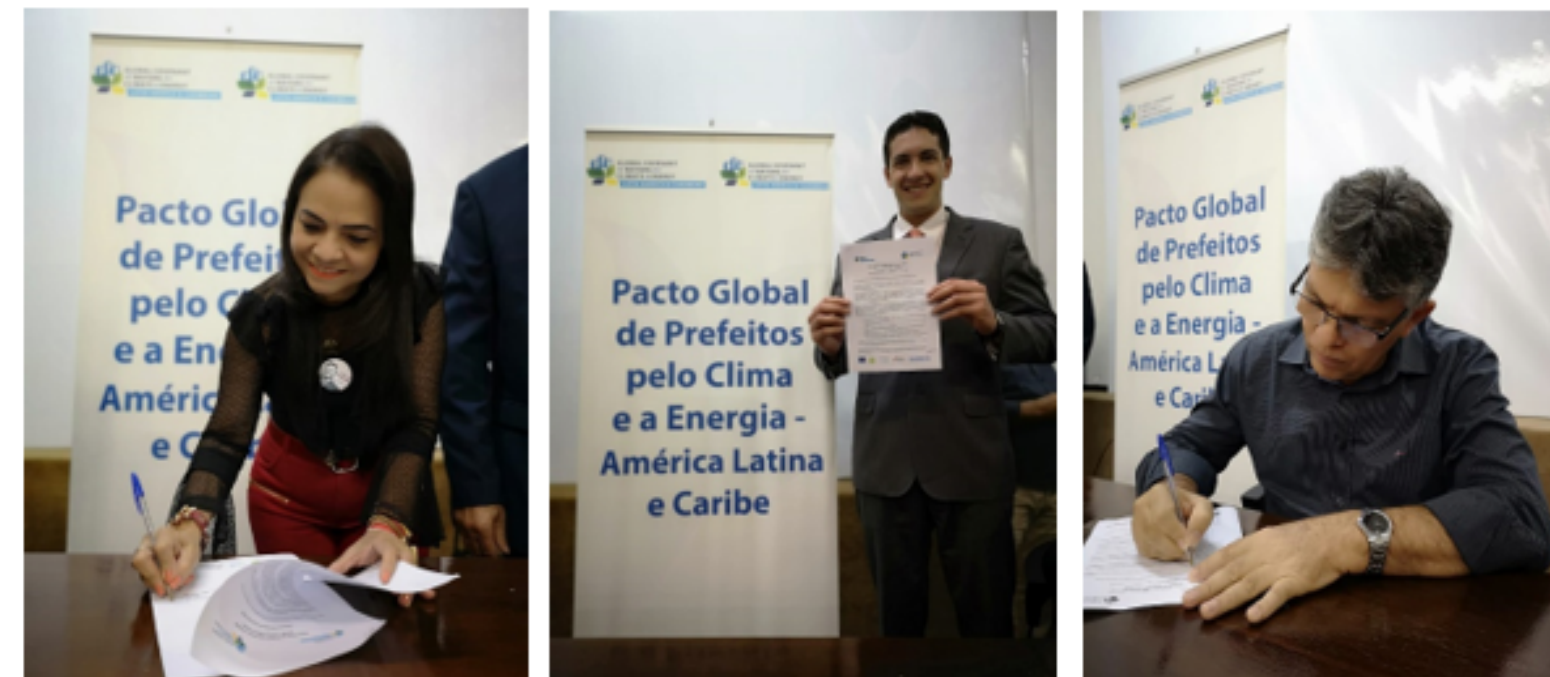
Ceremonia de adhesión al Pacto Global de Alcaldes

Agradezco muchísimo todo el trabajo y cooperación que hemos tenido durante estos años y espero que volvamos pronto en 2021 con el nuevo proyecto, para seguir trabajando juntos .