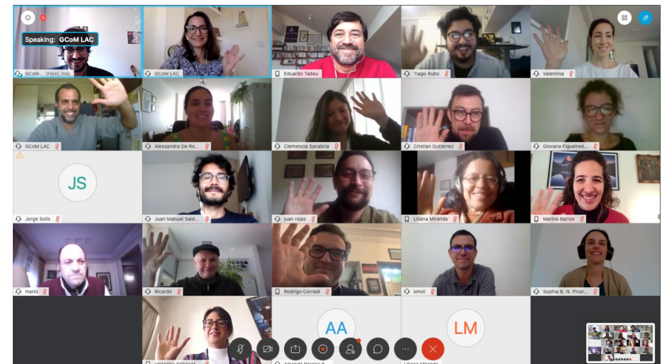
Foro permanente de Coordinadores Nacionales