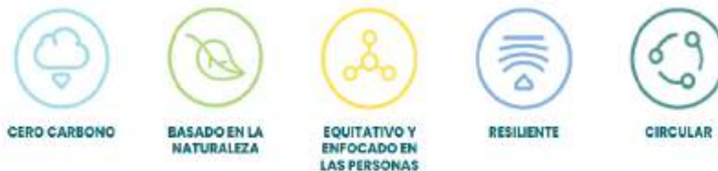
Figura 2: Los cinco caminos estratégicos ICLEI. Fuente: Elaboración propia

Los cinco caminos estratégicos ICLEI para un desarrollo bajo en carbono, basado en la naturaleza, equitativo, resiliente y circular están diseñados para generar un cambio sistémico. Los caminos son la base para diseñar soluciones integradas que equilibren los estándares de la vida humana y los entornos naturales y construidos.