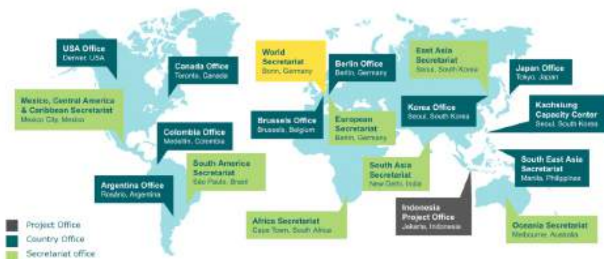
Figura 2: Presencia de ICLEI en el mundo.

Nuestra red y nuestro equipo de expertos trabajan juntos ofreciendo acceso al conocimiento, asociaciones y capacitación para generar cambios sistémicos a favor de la sustentabilidad urbana.